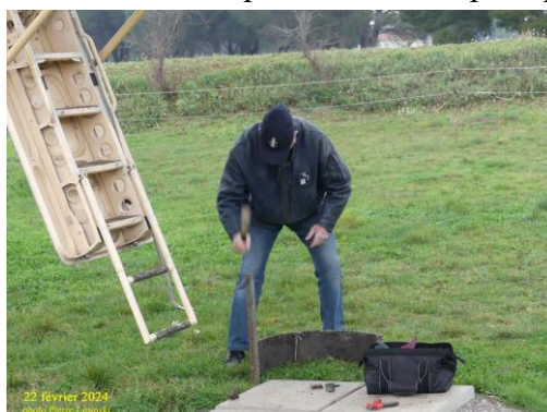
23 février 2024

Par ailleurs, la mise en place du nouveau revêtement de sol a continué, et les conditions météo, plutôt boueuses malgré la sécheresse induite par le réchauffement climatique, ont contraint à ajouter un outil de décrochage des chaussures au pied de l'avion, pour préserver ce tapis.