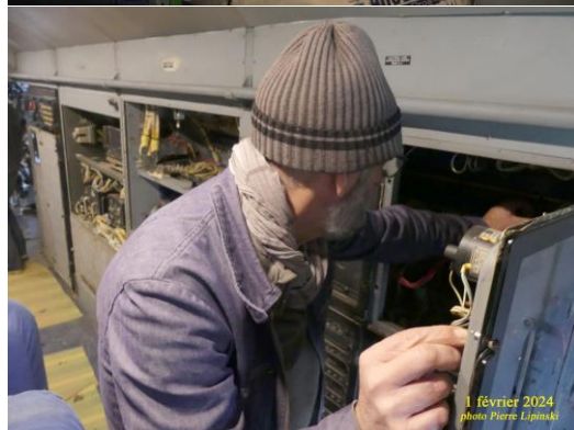
1 février 2024

Les travaux entamés précédemment, éclairage des boîtes de commande, manœuvre des portes de train ont continué, avec parfois des surprises : la pompe hydraulique a dû être réparée, suite à un refus flagrant de fonctionnement.