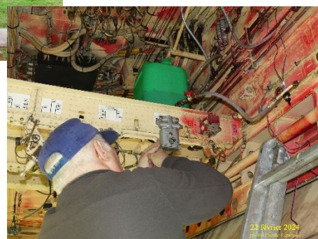
23 février 2024