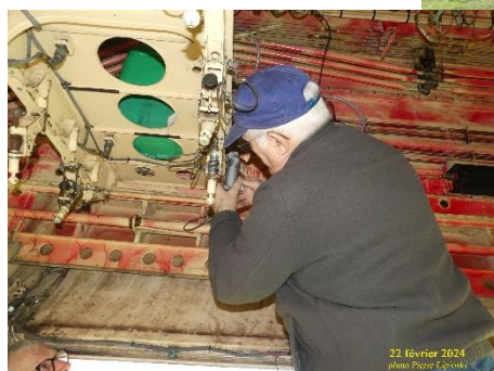
22 février 2024